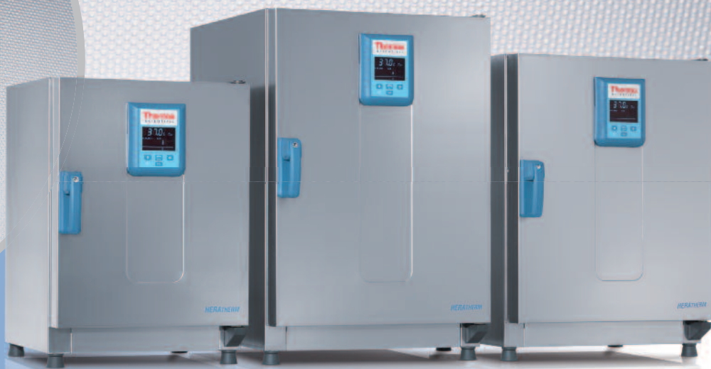
Incubateurs microbiologiques Heratherm Advanced Protocol Security avec extérieur soigné en acier inoxydable