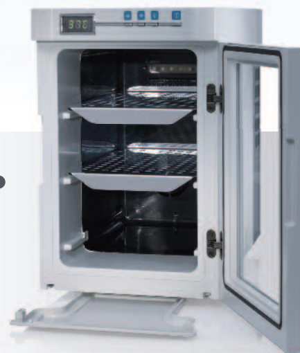
Incubateur microbiologique Heratherm Compact, 18 L

L'unité la plus compacte de la gamme d'incubateurs microbiologiques Heratherm offre une capacité de 18 L; une solution idéale pour un espace de travail personnalisé.