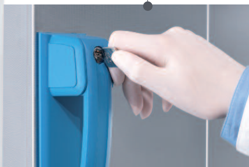
Porte verrouillable pour limiter l'accès aux échantillons