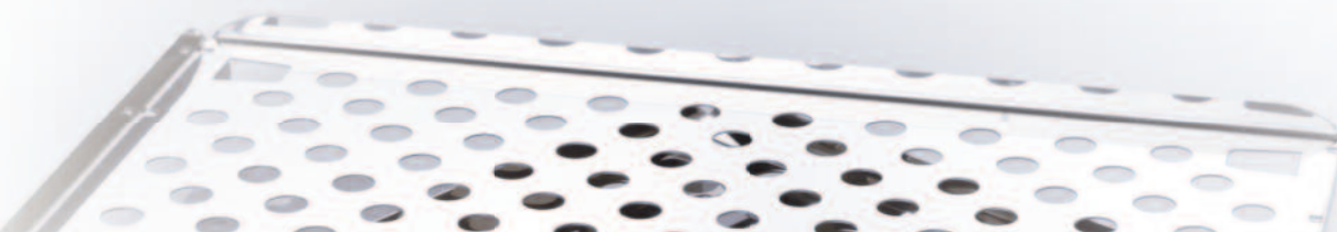
TABLEAU DES CARACTÉRISTIQUES/RÉFÉRENCES ACCESSOIRES