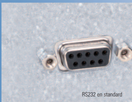
RS232 en standard

Le port d'accès permet d'insérer facilement des sondes de température indépendantes.