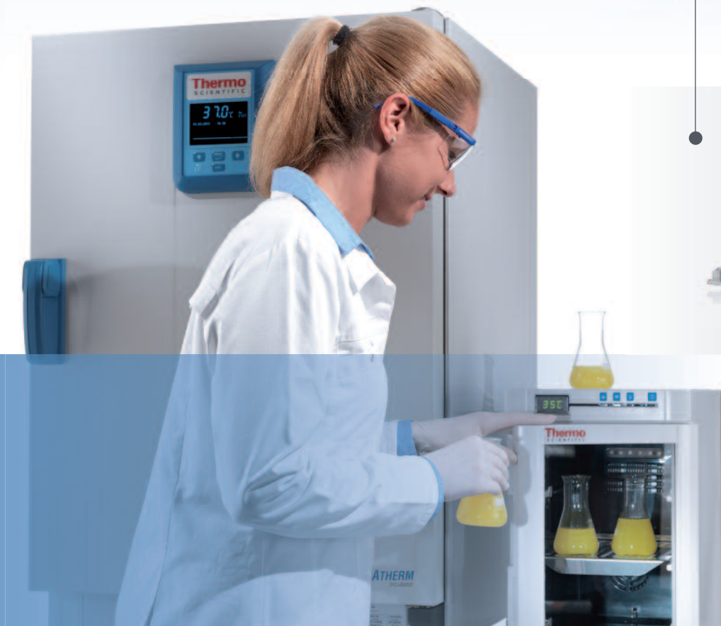
Une solution parfaite pour une incubation personnalisée

design intelligent pour les applications de faibles volumes