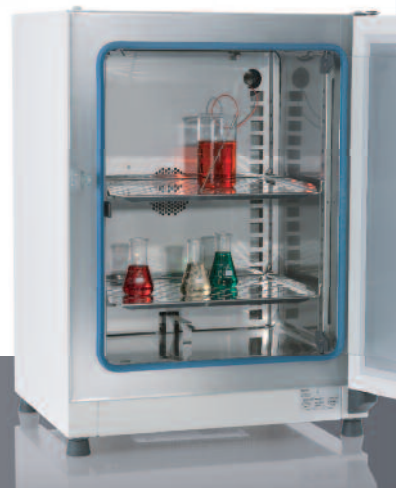
Incubateur microbiologique Heratherm Advanced Protocol Security doté d'un système exclusif de convection double et de systèmes d'alarme supplémentaires

Forts de notre technologie reconnue de décontamination des incubateurs à CO 2 , nous vous présentons les premiers incubateurs microbiologiques disposant d'une routine de décontamination à 140°C certifiée par un institut indépendant. †