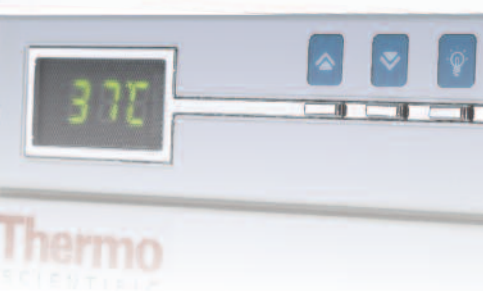
Interface facile à utiliser

NOTE: les chiffres indiqués sur ces 2 pages sont des valeurs moyennes observées sur des équipements de série, selon nos standards usine basés sur la norme DIN 12880. Veuillez contacter votre représentant local pour plus d'information sur la qualification ou les documents QI/QO.